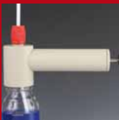
Seite 211: Probennahmepumpe