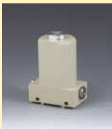
Membranpumpe mit PTFE-Faltenbalgkolben; Druckluftantrieb

Neben den auf diesen Seiten aufgeführten Pumpen, konstruieren und fertigen wir auch kundenspezifische Pumpen. Diese Pumpen werden in einer Vielzahl von Geräten und Anlagen eingesetzt.