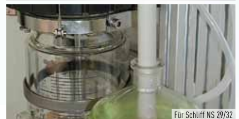
Für Schliff NS 29/32