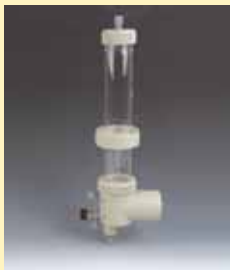
Dosiereinheit mit Schauglas, Sensorhalterung und druckluftbetriebenen PTFE-Faltenbalgkolben