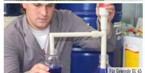
Für Gewinde GL 45