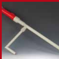
Seite 210: Batteriepumpe